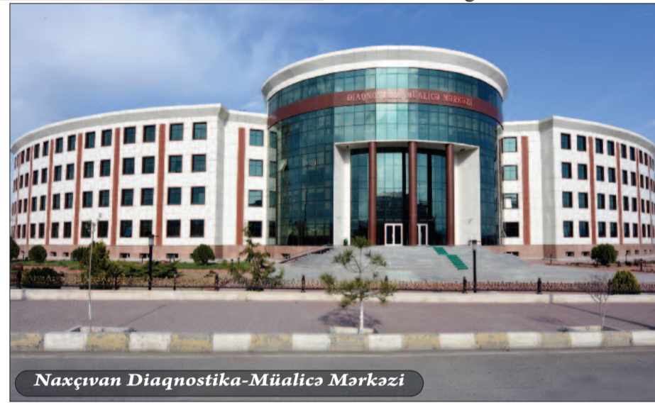
Naxçıvan Diaqnostika-Müalicə Mərkəzi

Bu gün muxtar respublikada səhiyyə sahəsində görülən işlər ancaq quruculuq tədbirləri ilə yekunlaşmır. Naxçıvan Muxtar Respublikası Ali Məclisi Sədri 2003-cü il 27 may tarixli Sərəncamı ilə muxtar respublikanın dövlət səhiyyə müəssisələrində bütün növ pullu xidmətlər ləğv edilmişdir. Yaradılan şərait muxtar respublikada insanların kütəvi tibbi müayinədən keçirilməsi tədbirlərinin də uğurlu icrasını təmin etmişdir. Dispanserizasiya işini daha da yaxşılaşdırmaq məqsədilə yerlərdə davamlı olaraq əhalinin müayinə-müalicə işi, səhiyyə, təhsil və mədəniyyət müəssisələrində mammoqrafiya müayinələri aparılır. Həmçinin Azərbaycan Respublikası Prezidentinin 2013-cü il 10 dekabr tarixli Sərəncamı ilə təsdiq edilmiş “Uşaqların icbari dispanserizasiyadan keçirilməsinə dair Dövlət Proqramı”nın icrası da diqqət mərkəzində saxlanılır, kiçikyaşlı uşaqlar arasında tuberkulin sınağı və poliomielit xəstəliyinin profilaktikası,