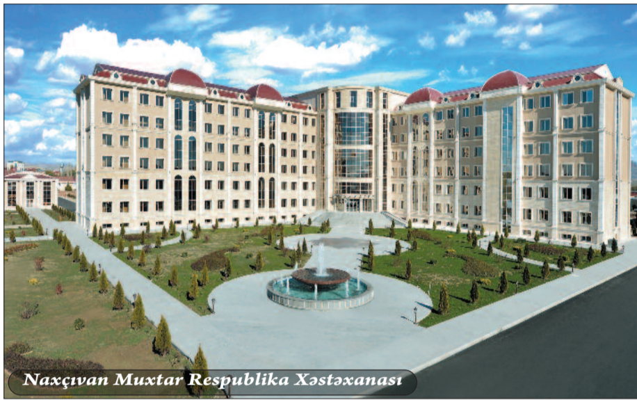
Naxçıvan Muxtar Respublika Xəstəxanası

lara uyğun qurularaq və yeni tibbi avadanlıqlarla təchiz olunaraq istifadəyə verilmişdir.